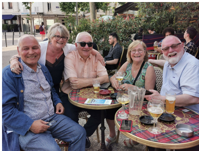
Un congrès c'est aussi des moments de convivialité : une partie des 6 participants du Calvados.